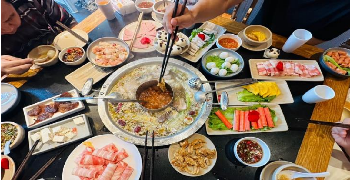
ค่ำ รับประทานอาหารค่ำ ณ ภัตตาคาร (มีที่นั่ง 12) *เมนูพิเศษสุกี้หมอลำเสวน